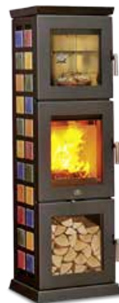
BACKOFEN: Lassen Sie die Lagerfeuerromantik für sich arbeiten. Der Kaminofen Prato von Max Blank backt stromfrei Brot und Brötchen und verströmt dabei leckeren Duft. Infos und Händlersuche über www.maxblank.com

Kaminöfen leisten mehr, als auf schönste Weise Wärme zu erzeugen. So werden Modelle mit Back- oder Bratfunktionen zum verlängerten Arm der Küche. Für frische Brötchen muss am Morgen niemand mehr hinaus in die Kälte, und den Duft der Backstube bekommt man gleich noch dazu. Seit jeher versammelten sich Menschen ums Feuer. Wem vor allem wichtig ist, möglichst nahe am lodernen Leuchten zu sitzen, der findet Kaminöfen mit speziell dafür vorgesehenen Sitzflächen. Wer hingegen weniger Platz zur Verfügung hat, kommt durch Bioethanol-Öfen an das heiß ersehnte Flammenspiel – und noch dazu ohne Ruß. Um auf Nummer sicher zu gehen, sollte aber auch der Kauf dieser Öfen nur im Zuge einer professionellen Beratung erfolgen. Für Kostenersparnisse sorgen Öfen mit integriertem Wasserwärmetauscher. In Niedrigenergiehäusern sind die energieeffizienten Öfen ein Dauerbrenner.