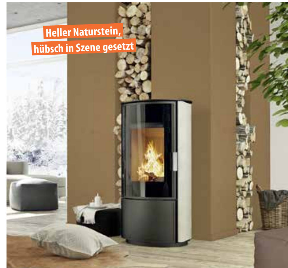
SCHMEICHELHAFT: Wie schick Kaminöfen sind, zeigt Modell Zoom. Die Scheibe ist gebogen, die Verkleidung spielt mit Kontrasten. Händlersuche über www.ofenkoppe.com

TEXT: HEIKE HEEL