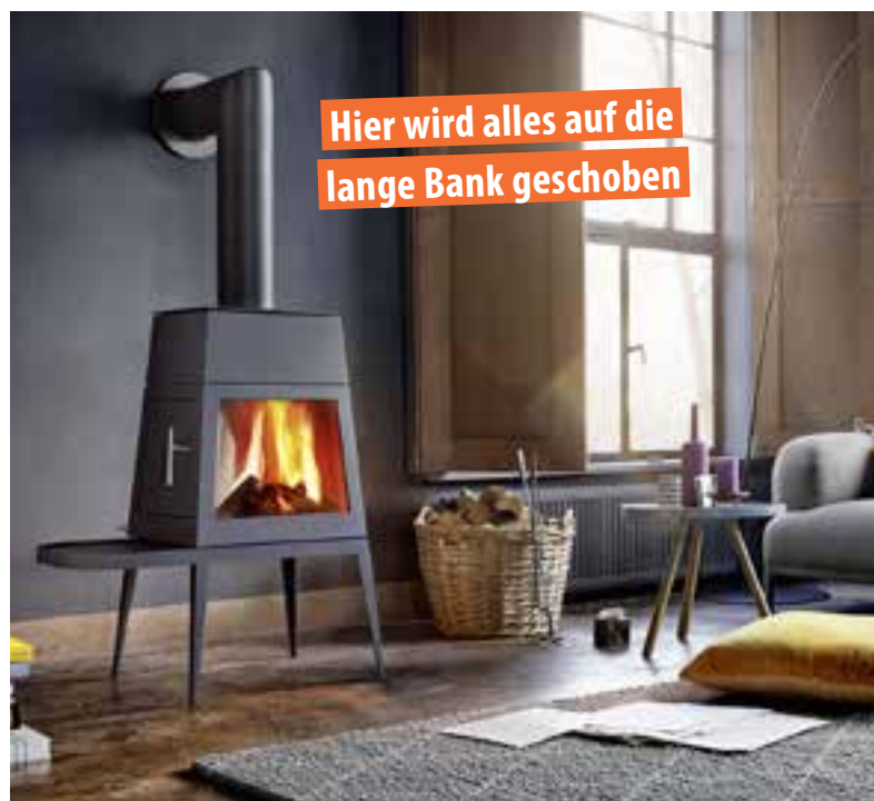
DESIGNLIEBLING: Beim Kamin Shaker lädt eine Sitzbank in Wunschlänge zum Verweilen ein. Von Skantherm, mit kurzer Bank für ca. 2460 Euro