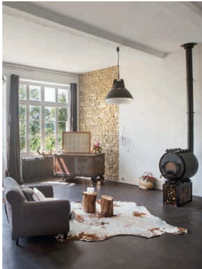
RUNDE SACHE: Solche Brennkammern beeindruckten sehr. Infos zum Bullerjan, dem Prototyp platzsparender Kamine, gibt es unter www.bullerjan.com