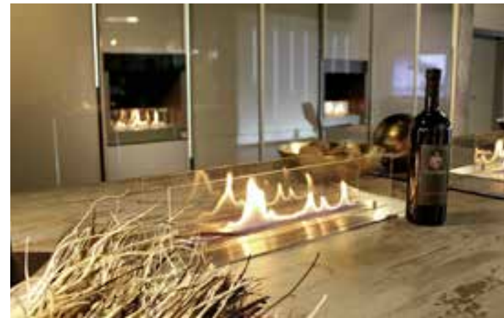
RUSSFREI: Dieser mit Ethanol betriebene Ofen der Reihe Ebios-Fire lässt sich auch im Küchenblock einbauen. Von Spartherm, ab ca. 3880 Euro. TIPP: Es gibt auch aus Abfall gewonnenes Bio-Ethanol