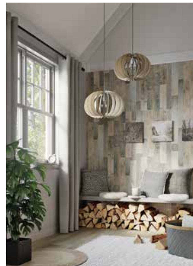
RAUMGEFÜHL: Neben dem Kamin lässt sich das Feuerholz in Szene setzen, wie vor der naturfarbenen Vliestapete. Holzwagen mit Rollen oder Henkelkörbe sind praktische Helfer. Tapete Factory III Holz von Rasch über www.hornbach.de , ca. 16 Euro/Rolle. Wagen Brændevogn über www.connox.de , ca. 385 Euro. Korbset von Tingo Living, ca. 85 Euro