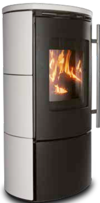
Body zwart met tegel zijde wit