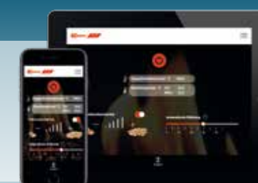
Bediening met smartphone of tablet