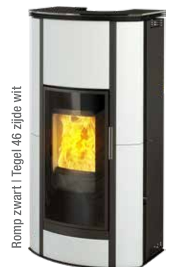
Romp zwart | Tegel 46 zijde wit

De motor heeft een 3-standen regelaar inclusief stopfunctie. Tevens wordt een schudrooster en RVS vultrechter bijgeleverd