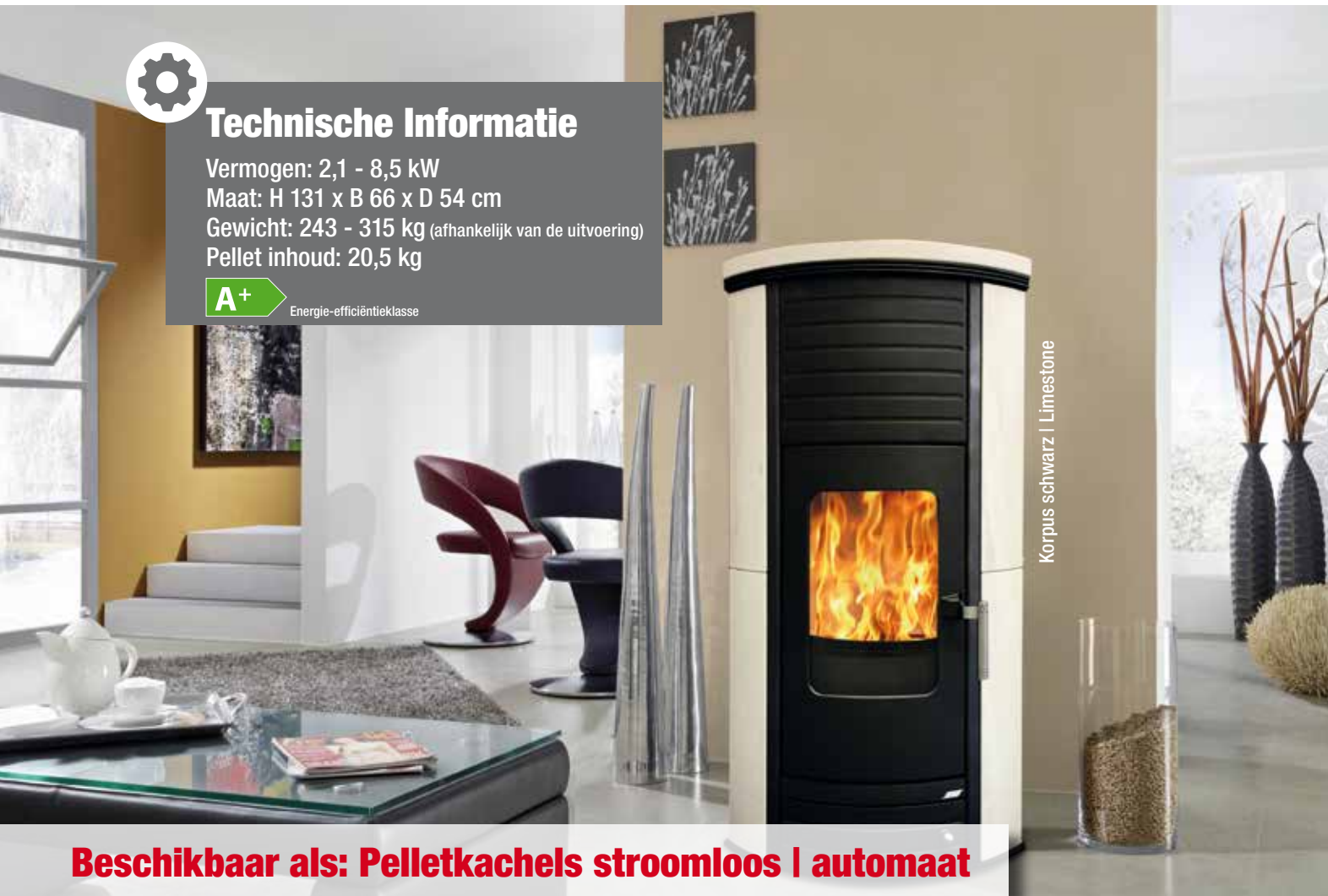
Korpus schwarz | Limestone

Beschikbaar als: Pelletkachels stroomloos | automaat