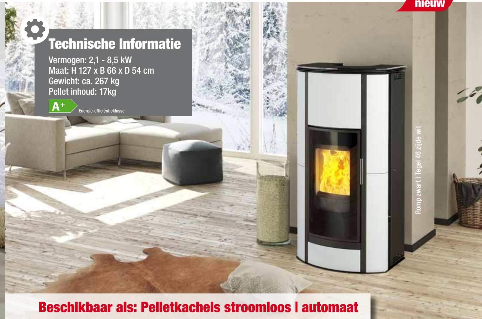
Romp zwart | Tegel 46 zijde wit

Beschikbaar als: Pelletkachels stroomloos | automaat