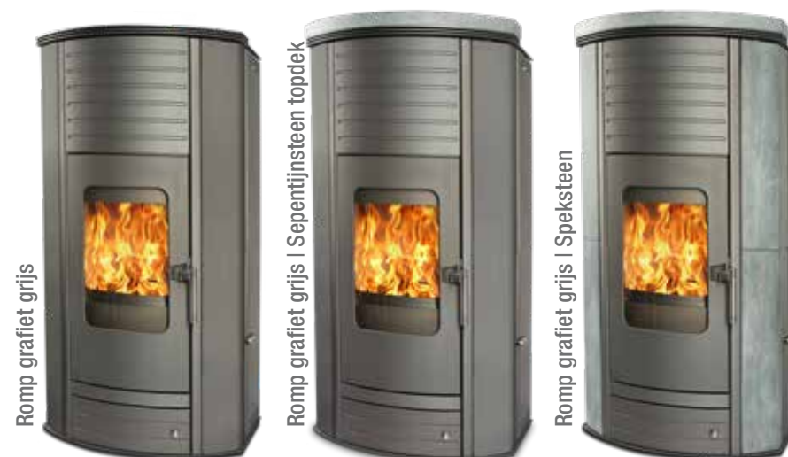
Romp grafiet grijs

3-standen regelaar met directe stopfunctie Geïntegreerde aslade, functioneel schudrooster en roestvrijstalen vultrechter