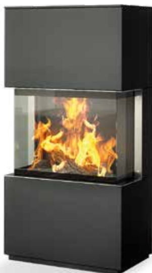
Korpus schwarz | Stahl schwarz mit Blende Edelstahl